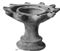
Fig. 1. Kernos 54 .

2. mobile , cutii de forme variate, cu capac perforat. Acestea puteau fi ținute în mână sau în picioare pe altare. Începând cu secolul V dHr unele exemplare au fost suspendate cu lanțuri, astfel încât să poată răspândi parfumul pe o suprafață mai mare, oscilând.