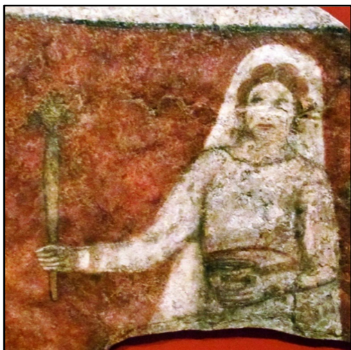
Fig. 2. Dura Europos 75 .

Cert pare să fie faptul că sunt realizate dintr-o pastă cu granulometrie grosieră, având ca ingrediente calcitul, cuarțul și mică, forma, fiind în perioada timpurie, trunchi de con la exterior, iar mai târziu aceasta devine tronconică 74 . Buza este evazată și ornamentată, deseori, prin stângerea între degete a celor două margini care o împodobesc, astfel că se obține un aspect ondulat. Piciorul este circular scobit.