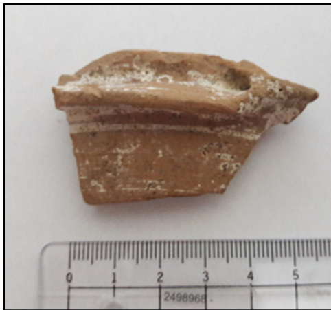
Fig.4. Al doilea fragment dintre cele descoperite fortuit la Bărboși, Galați.

2. Al doilea fragment Turibulum fragmentar ( Fig. 4 ), este realizat din pastă fină, ușor aspră la atingere, cărămiziu deschis, arsă uniform, prezintă o peliculă fină de