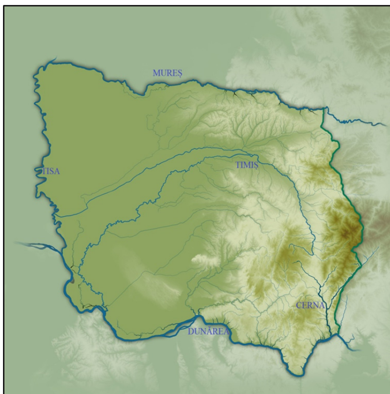
Fig. 1. Provincia istorică Banat 9 .

Istoriografia românească din secolul al XIX-lea a preluat această identitate, ignorând aspectele administrative 10 . Era posibilă, astfel, scrierea unei istorii a regiunii care, în raport cu țările vecine, păstra o individualitate definită de elementul românesc. În acest sens, istoricii români aduceau în sprijinul lor mărturiile călătorilor din secolele XV–XVI, ce confirmau uniformitatea etnică a părții răsăritene a provinciei 11 .