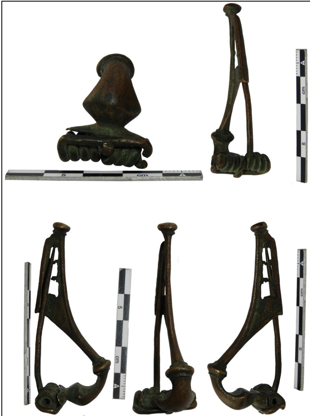
Fig. 3. Fibulă din bronz puternic profilată.