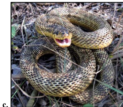
Fig. 2: a. vipera cu corn ( Vipera ammodytes ); b. șarpele rău ( Dolichophis caspius ); c. balaurul ( Elaphe sauromates ); d. șarpele lui Esculap ( Elaphe longissima ).