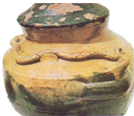
Fig. 3. Șarpe pe un cazan de răchie din ceramică de la Lăpușnicu Mare.