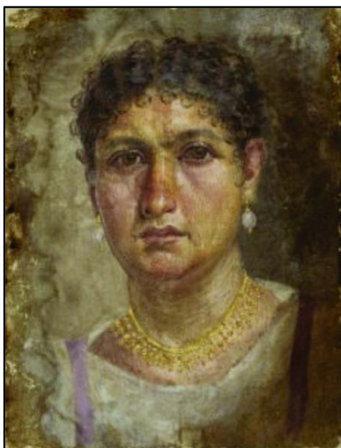
Fig. 1. Portretul lui Aline, datat între sec. I dHr și începutul sec. II dHr 23 .

regina Cleopatra a băut o perlă de 10 milioane de sesterți 21 . Această ultimă mențiune leza oarecum mândria romană, deoarece acest lux ar fi trebuit să fie desigur un apanaj roman, iar în același timp scriitorul scoate în evidență decadența specifică a acestui dușman al Romei. Ceea ce remarcă foarte bine Plinius este direcția din care vin aceste bunuri de lux la Roma. El menționează acest comerț cu obiecte de lux cu estul se situa la 100 de milioane de sesterți, din care jumătate cu India, însă specifică cu amărăciune că această sumă este egală cu cinci perle ale Cleopatrei 22 .