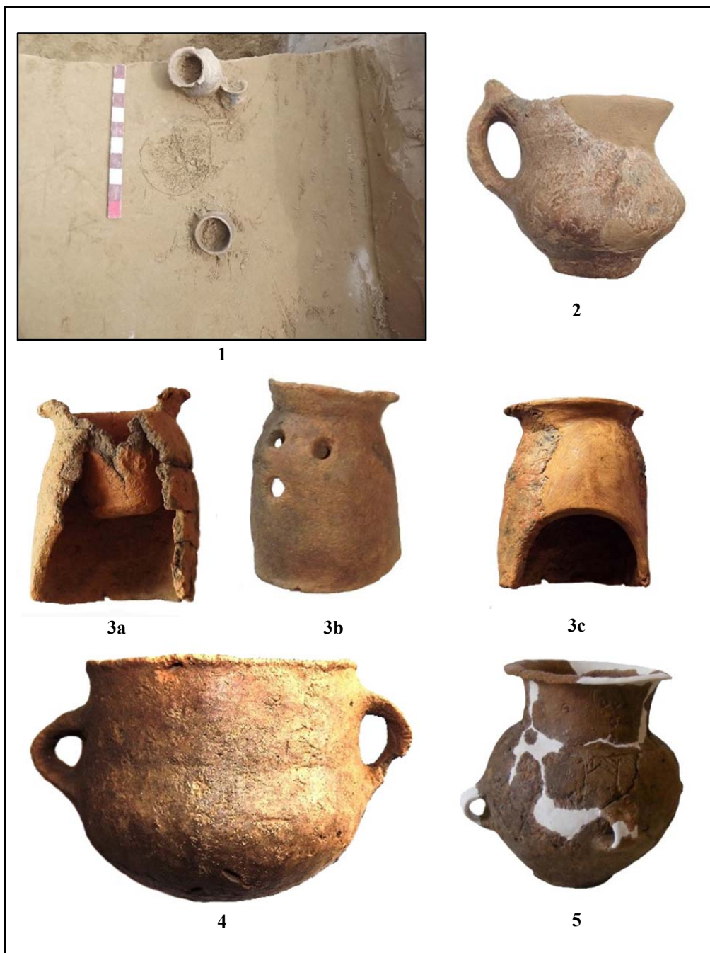
Fig. 2. Mormântul 10; 2. ceașcă; 3a–c. vas pyraunos ; 4–5. amfore.