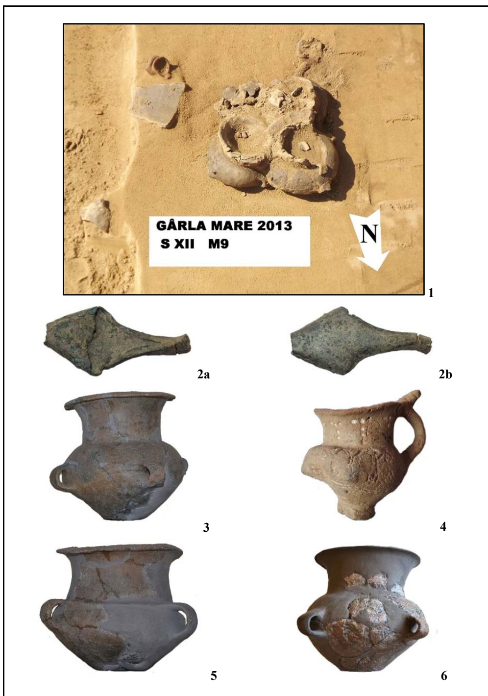
Fig. 1. 1. Mormântul 9; 2a–b. fragment de ac; 3. amforă; 4. ceașcă; 5–6. amfore.