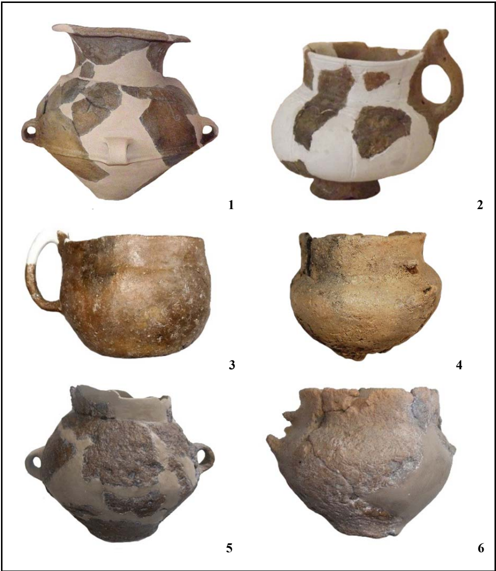
Fig. 5. 1. amforă; 2. ceașcă; 3. cană; 4–6. amfore.