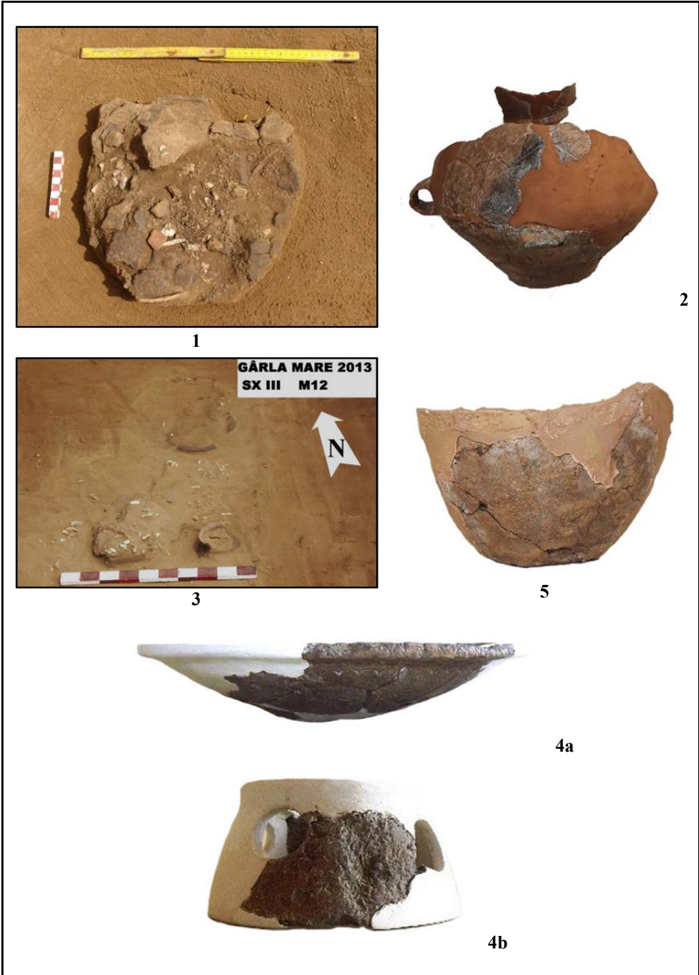
Fig. 3. 1. Mormântul 11; 2. amforă M11; 3. Mormânt 12; 4a-b. fructieră; 5. amforă.