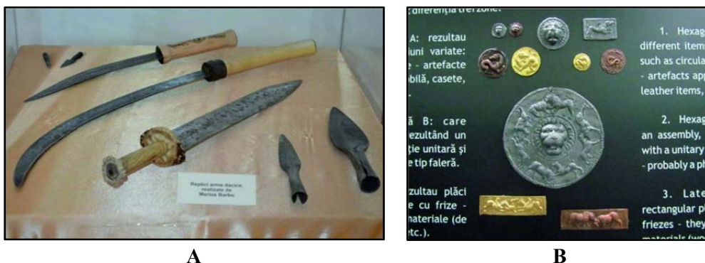
Fig. 4. Produse ale arheologiei experimentale utilizate în cadrul expozițiilor Muzeului Civilizației Dacice și Romane din Deva.

O altă întrebuintare a produselor rezultate în urma desfășurării experimentelor arheologice este aceea de a fi expuse, în cadrul unor proiecte de pedagogie muzeală sau în cadrul expozițiilor tematice, organizate de diferite instituții muzeale (Fig. 4). În ceea ce privește dezvoltarea celor două concepte în țara noastră, putem afirma că, deși se află la început, ele prind tot mai bine contur, fiind din ce în ce mai apreciate de către specialiști (cazul arheologiei experimentale) sau de către publicul larg (cazul reconstituirii istorice).