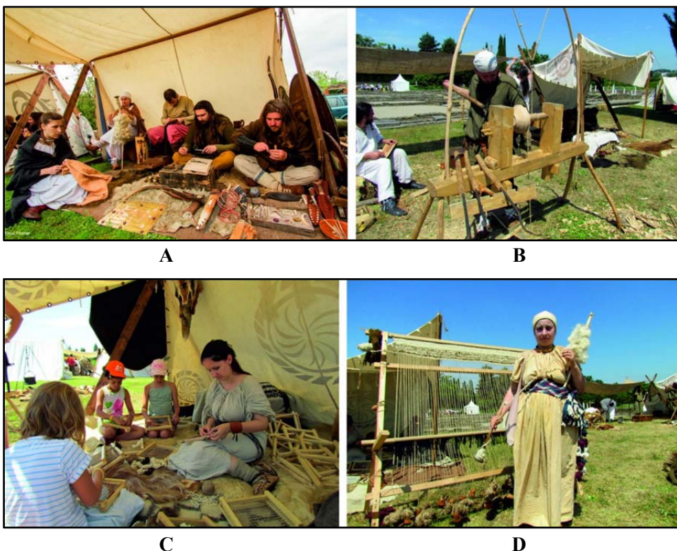
Fig. 6. Reconstituirea unor ateliere meșteșugărești dacice. Membrii asociației Terra Dacica Aeterna .

Principala activitate a organizațiilor enumerate mai sus este aceea de a pune în scenă diverse spectacole, în care să prezinte publicului aspecte legate de viața civilă (Fig. 6) și militară (Fig. 7) a civilizațiilor antice. Acest lucru are loc, de cele mai multe ori, în cadrul unor festivaluri de “reenactment” din țară sau din străinătate, special organizate în acest sens.