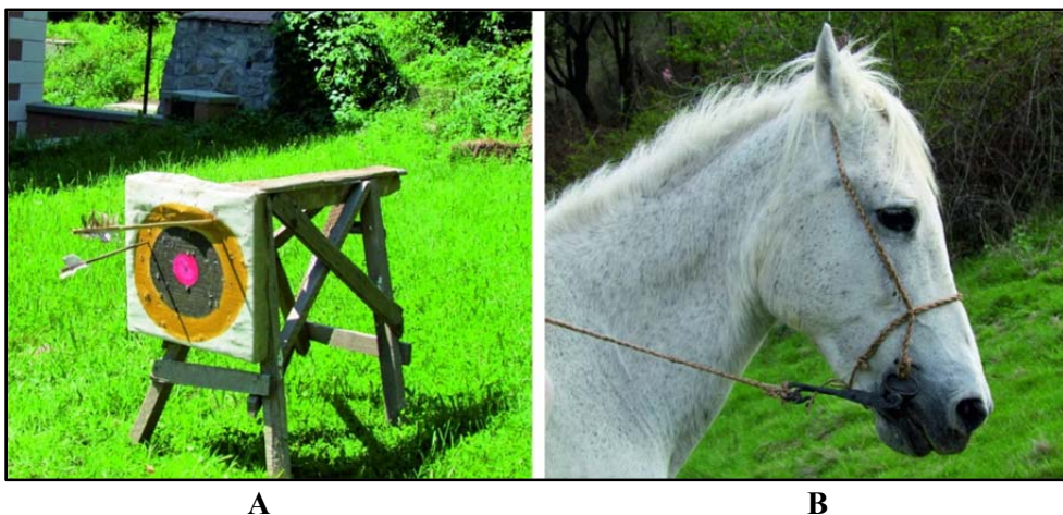
Fig. 5. Teste privind funcționalitatea unor arme și piese de harnașament din epoca dacică.

Câțiva istorici și arheologi români au utilizat aportul arheologiei experimentale în vederea exploatării multilaterale a unor subiecte legate de lumea dacică. Alături de studiul clasic, testele experimentale au putut aduce noi informații, sporind astfel cunoștințe legate de utilitatea și funcționalitatea unor arme sau echipamente. Este cazul testării eficienței unor tipuri de vârfuri de săgeți, descoperite în cetatea dacică de la Ardeu (jud. Hunedoara) 20 (Fig. 5a), a unei săbii curbe provenită din cetatea dacică de la Divici (jud. Caraș-Severin) 21 , a binecunoscutelor zăbale de tip tracic 22 (Fig. 5b) sau a caracteristicilor scuturilor utilizate în lumea dacică 23 .