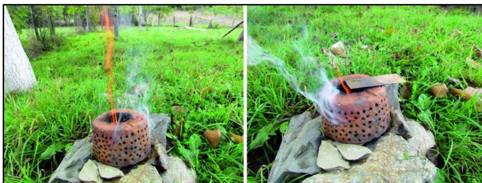
Fig. 2. Experimente privind funcționalitatea unor instalații de combustie din perioadă dacică descoperite la Măgura Uroiului (jud. Hunedoara).

Arheologia experimentală nu se rezumă doar la efectuarea unor experimente, datele oferite de către acestea fiind înregistrate și analizate de specialiști. În urma acestor procese, sunt elaborate o serie de concluzii, care mai apoi sunt publicate sub forma unor studii, articole ori cărți de specialitate, care constituie de la bun început scopul demarării experimentelor. Din această cauză, pentru realizarea unor experimente arheologice valide, este nevoie ca persoanele care le realizează să dețină în același timp atât cunoștințe arheologice de specialitate, cât și o amplă experiență practică în ceea ce privește tehnicile utilizate 10 . Fără aportul unui arheolog specializat în perioada crono-logică vizată și problematica abordată, testele vor fi lipsite de bază istorică, iar lipsa experienței practice sau a cunoștințelor de ordin tehnic vor duce la incapacitatea punerii în practică sau la o realizare necorespunzătoare a experimentelor. Astfel, de multe ori, studiile de arheologie experimentală sunt realizate de către echipe, în care membrii își împart sarcinile de lucru 11 .