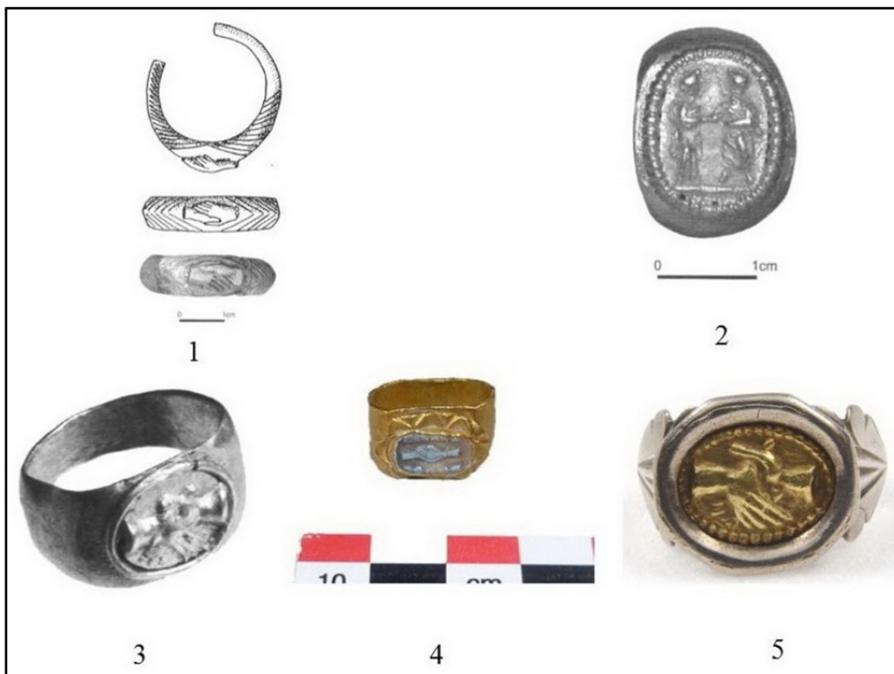
Fig. 1. Obiecte decorate cu reprezentarea dextrarum iunctio descoperite pe teritoriul Imperiului Roman: 1. Inel, Apulum (după Cociș, 1994, 55, nr. cat. 29, pl. XIII/29; Isac, 2001, p. 188, nr. 2, Abb.2); 2. Inel, Cristești (după Isac, 2001, 188, nr. 1, Abb1); 3. Inel, Tibiscum-Jupa (după Flutur, 2013, p. 499, nr. cat. 123.1); 4. Inel, Bradwell (după The British Museum Collection, nr. AF. 418); 5. Inel, Britannia (după

În concluzie , nu negăm faptul că, în antichitate, unele podoabe cu o astfel de reprezentare au fost probabil considerate inele de logodnă 69 și purtate ca atare. Dar unele dintre acestea erau probabil purtate în virtutea faptului că mâinile împreunate reprezentau conceptul de fides și concordia între camarazi, precum și loialitatea armatei față de împărat; implicit, se poate specula că acestea erau probabil un semn de apartenență al individului la “familia armatei”. Acest tip de reprezentare atrage atenția asupra faptului că bijuteriile nu trebuiesc studiate în mod separat, ci ele trebuiesc privite în contextul mai larg oferit de istoria artei, numismatică, religie, istorie socială, economie și politică în lumea romană.