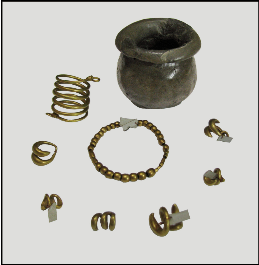
Fig. 3. Vasul de lut și piesele de aur din tezaurul de la Răcățău, jud. Bacău.